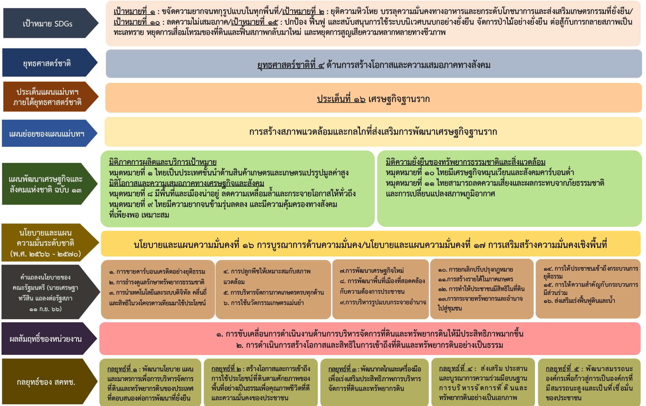
ภาพที่ ๒ ผังสรุปความเชื่อมโยงยุทธศาสตร์ของแผนปฏิบัติราชการ ระยะ ๕ ปี (พ.ศ. ๒๕๖๖ - ๒๕๗๐) สคทช.